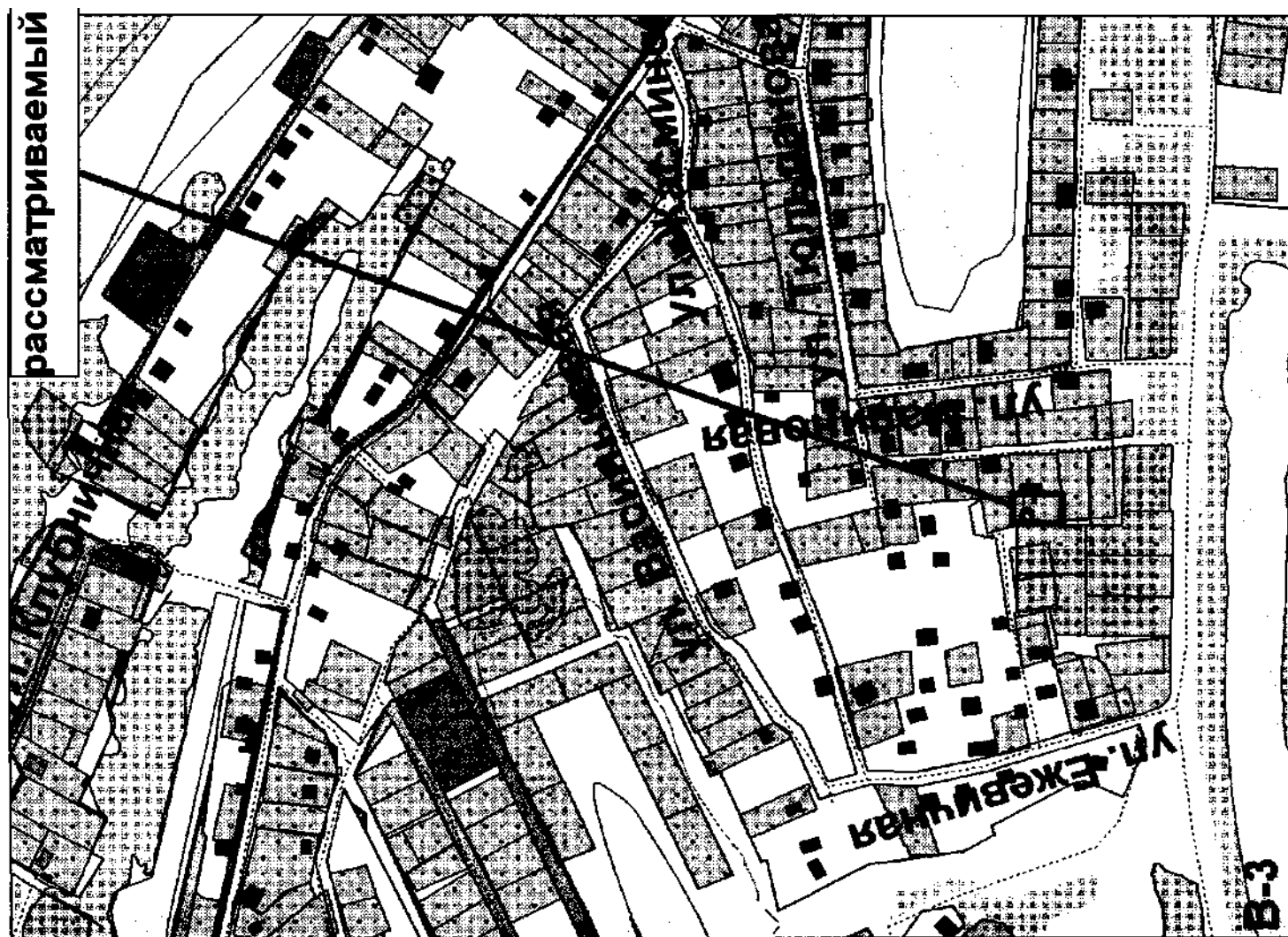
1. Земельный участок площадью 0,0434 га, под садоводство г. Новокуйбышевск, СДТ «Садовый берег» Управление архитектуры и градостроительства по заявлению Плясунова В.Н. (схема № 1).